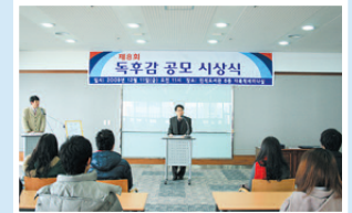
제 8회 독후감 공모전 수상자 명단